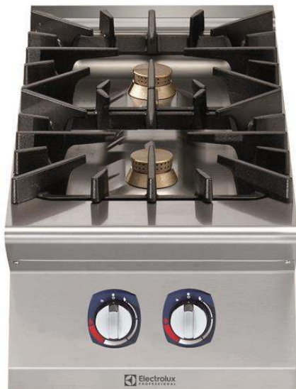
391000 (E9GCGD2C00) Plynový sporák, 2 hořáky (2x6kW), 1/2 modul - 400mm, bez podestavby